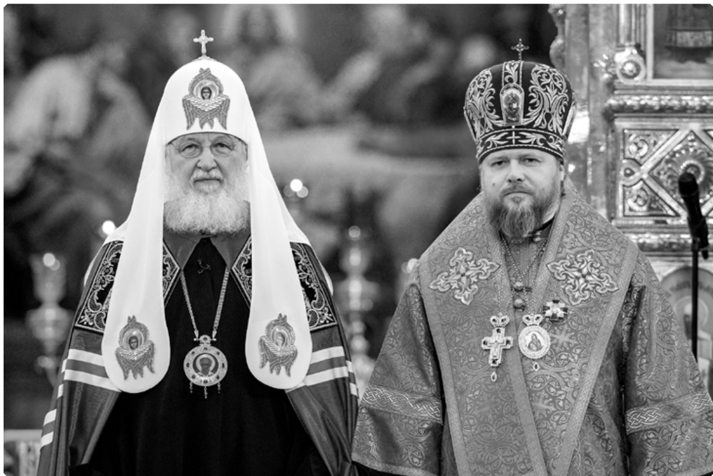
Святейший Патриарх Кирилл и Преосвященный Серафим, епископ Бийский и Белокурихинский. Патриаршее служение в день памяти святителя Николая Чудотворца в Храме Христа Спасителя. 22 мая 2022 г.

11 июня. Епископ Бийский и Белокурихинский Серафим совершил освящение памятника