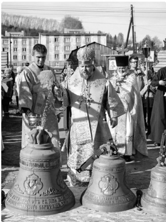
Освящение колоколов в селе Алтайском Алтайского района. 16 октября 2022 г.

30 декабря. На 66-м году жизни в результате обострения хронической болезни скончался благочинный Белокурихинского округа, настоятель