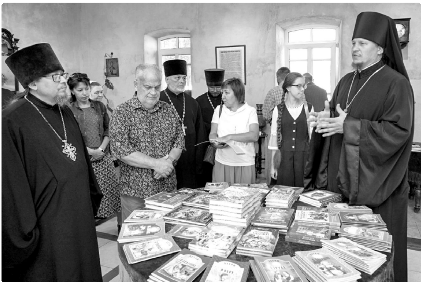
Презентацию книжных изданий проводит иеромонах Макарий (Комогоров) (ныне – епископ Козельский и Людиновский Макарий). Выставочный центр Бийского архиерейского подворья. Бийск. 3 сентября 2022 г.