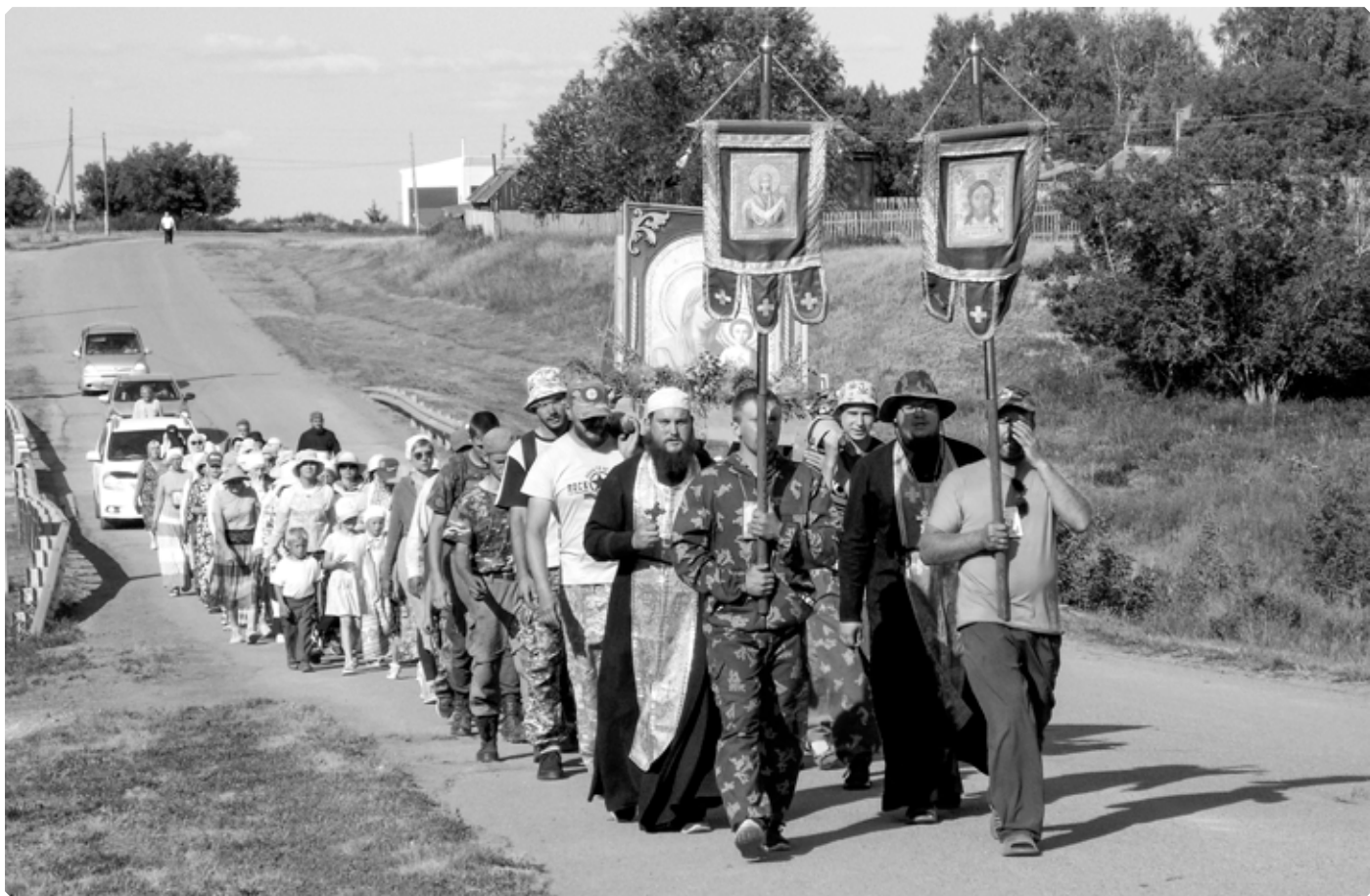
Крестный ход на пути в село Коробейниково. 1 июля 2022 г.