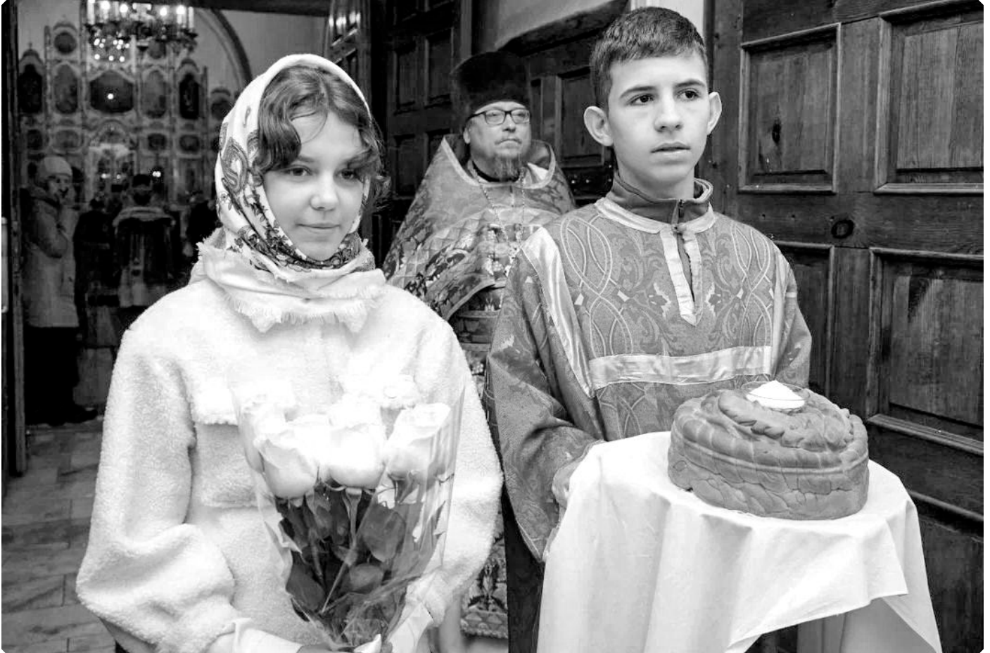
Перед встречей правящего архиерея. Казанский храм города Бийска. 4 ноября 2025 г.

Из акафиста Пресвятой Богородице в честь иконы Ея «Казанская»