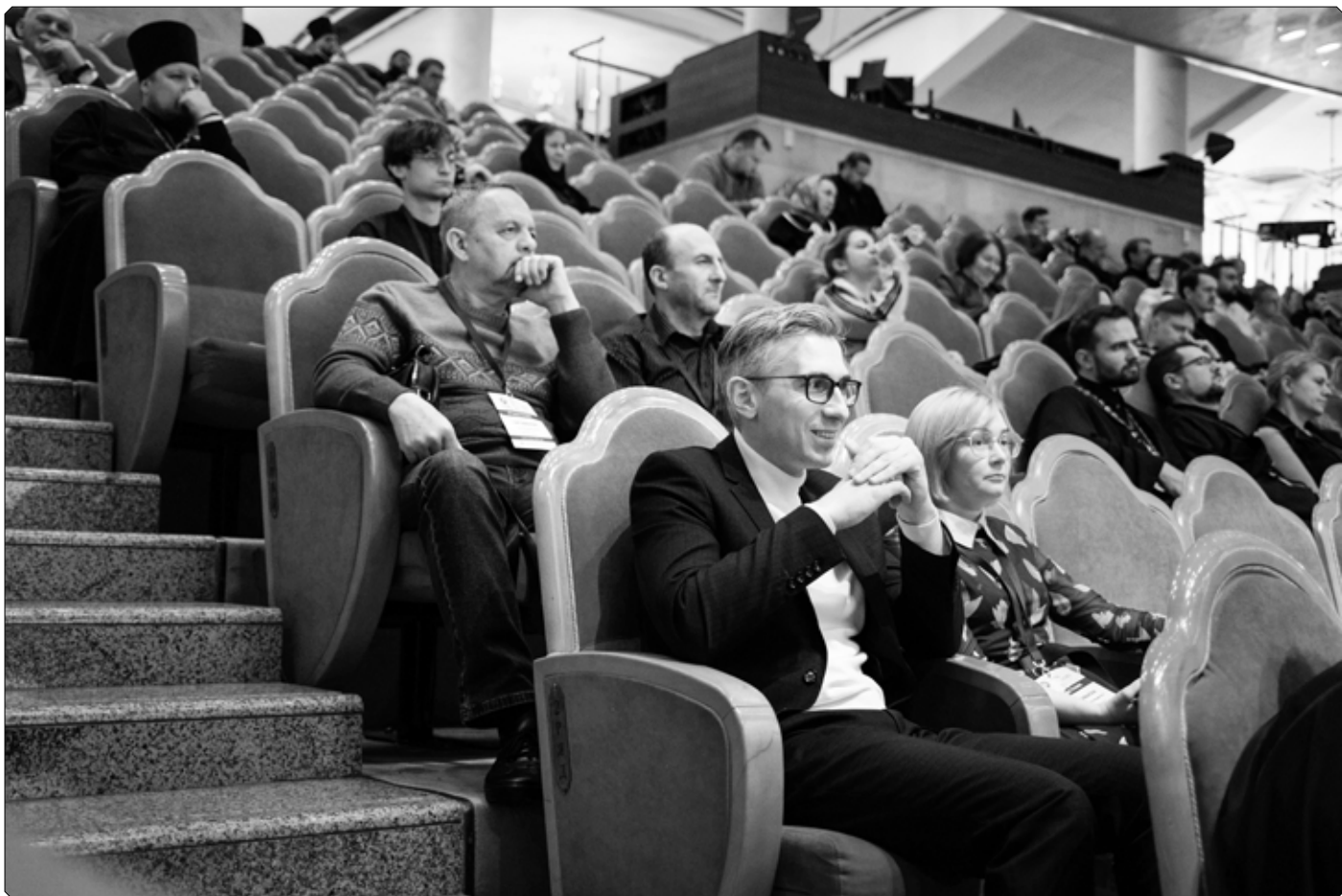
Делегаты Бийской епархии на встрече Святейшего Патриарха Кирилла с участниками XI Международного фестиваля православных СМИ «Вера и слово». Храм Христа Спасителя города Москвы. 16 октября 2025 г.

Конечно, не для всех вопросов можно найти быстрое решение – правильные ответы не всегда лежат на поверхности. Но убежден, что тема достойного и убедительного присутствия Церкви в информационном пространстве должна стать предметом глубокого и вдумчивого осмысления, в том числе участниками настоящего фестиваля.