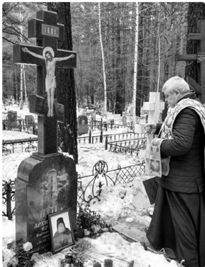
Лития на могиле архимандрита Ермогена (Росицкого). Заречное кладбище города Бийска. 12 марта 2023 г.

Окончание следует