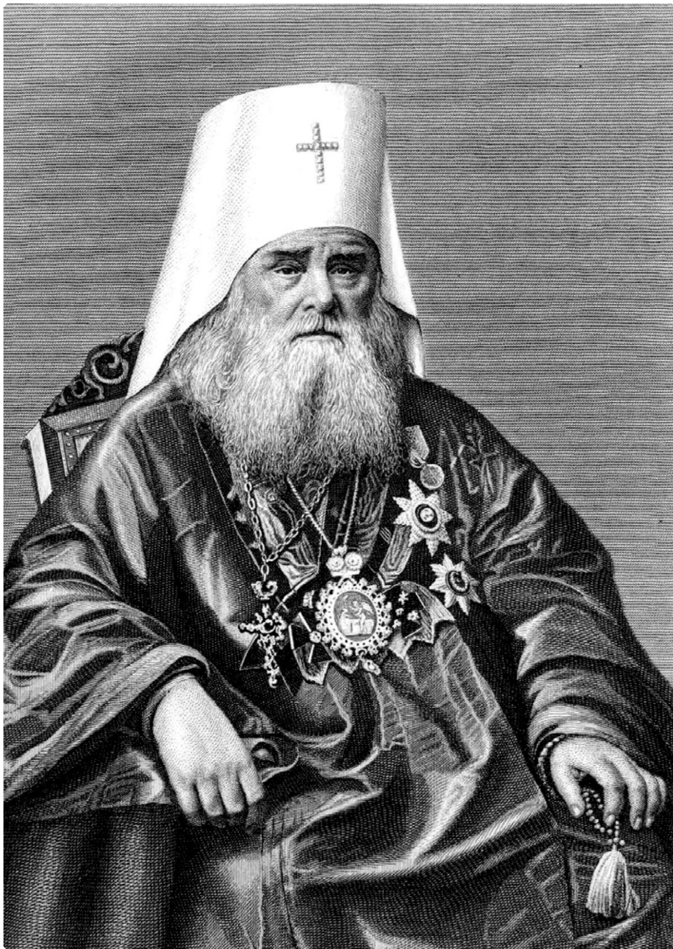
Высокопреосвященнейший Иннокентий, митрополит Московский и Коломенский (1868–1879). Бывший архиепископ Камчатский, Курильский и Алеутский (1840–1868). Гравюра. – С.-Петербург : Издание П.П. Протасова, 1894.