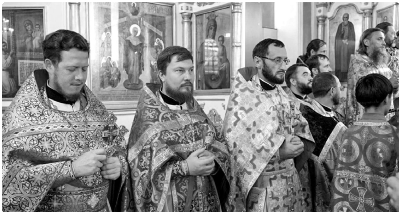
Духовенство Бийской епархии на праздничном богослужении в Успенском кафедральном соборе города Бийска. 28 августа 2025 г. Фото Сергея Доровских

Текст книги и фото предоставлены православным порталом «Азбука веры»: https://azbyka.ru/