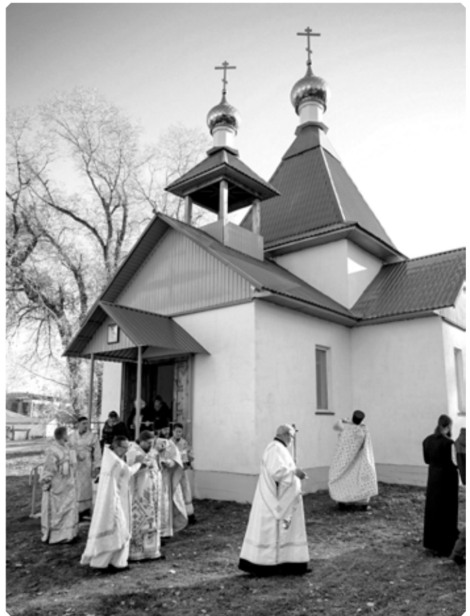
Освящение Свято-Владимирского храма в селе Сетовка Советского района. 15 октября 2022 г.

15 октября. Епископ Бийский и Белокурихинский Серафим совершил чин великого освящения храма и Божественную литургию в новоосвящен-