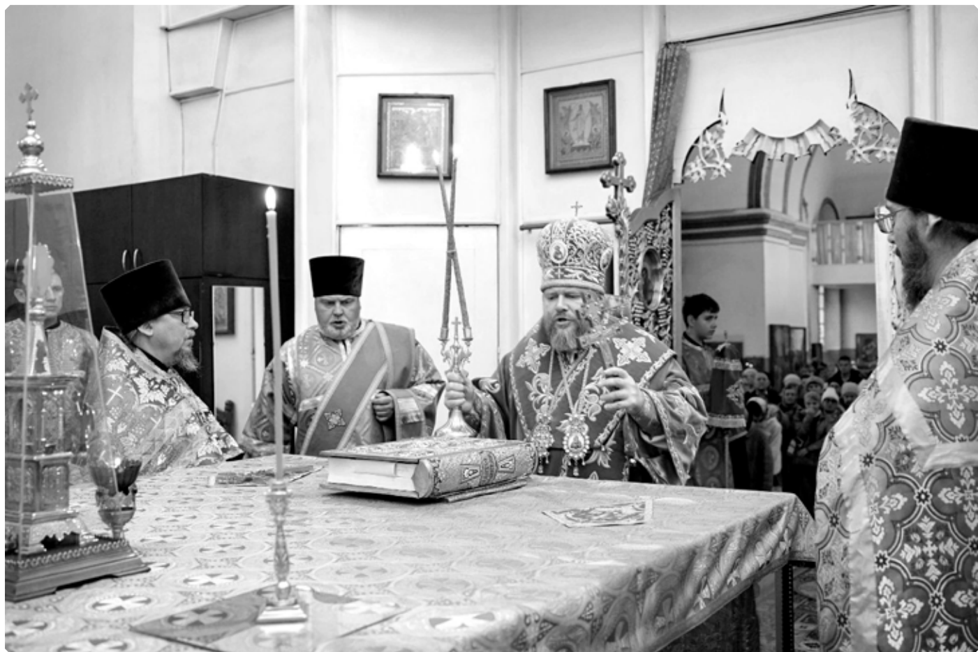
Преосвященный Серафим, епископ Бийский и Белокурихинский, с сослужащим духовенством в алтаре Казанского храма. Бийск. 4 ноября 2025 г.

и Семипалатинского Исаакия. Строилась Казанская церковь тоже при владыке Макарии. Своего попечения об Алтайской духовной миссии, Бийском архиерейском подворье и Казанской церкви святой не оставил и после перевода в 1891 году на Томскую кафедру. Новопостроенный храм был освящен 8 ноября 1892 года. Томский Преосвященный, посещая Бийск, при всяком удобном случае стремился оказаться на любимом подворье, послужить в Казанской церкви или просто побывать там на богослужении.