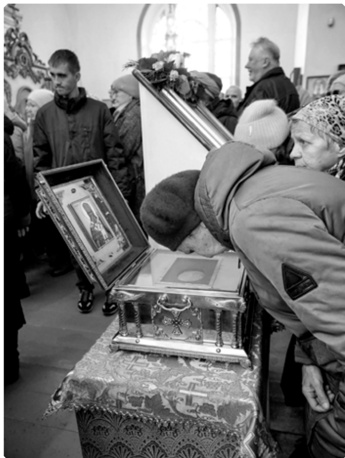
У мощей святителя Иннокентия.

Прошедшее 4 ноября в Казанском храме праздничное богослужение стало своеобразным итогом празднования 195-летия Алтайской духовной миссии, 145-летия Бийского архиерейского подворья и 10-летия возрождения Бийской епархии, образованной в 2015 году в составе Алтайской митрополии. Богатый на юбилейные даты церковный календарь Бийской епархии 2025 года пополнился еще одной – 200-летьем начала миссионерского служения святителя Иннокентия, митрополита Московского, участие в общецерковном праздновании которого наша епархия приняла с 1 по 7 ноября, когда в ее пре-