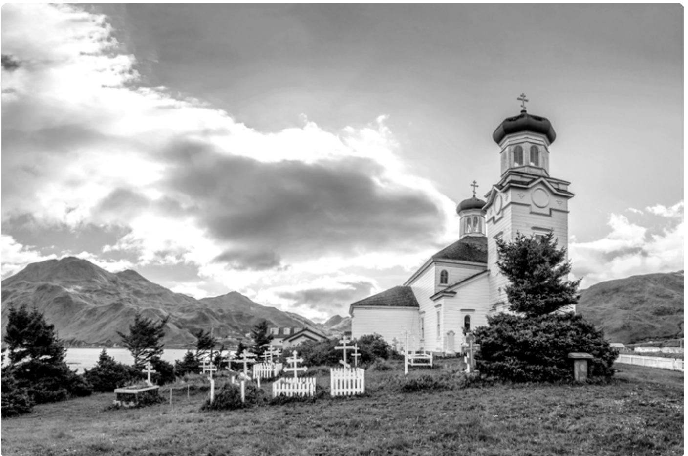
Церковь Вознесения Господня города Уналашка в наши дни. Штат Аляска, США.

В постоянных путешествиях по островам своего прихода отец Иоанн часто подвергался