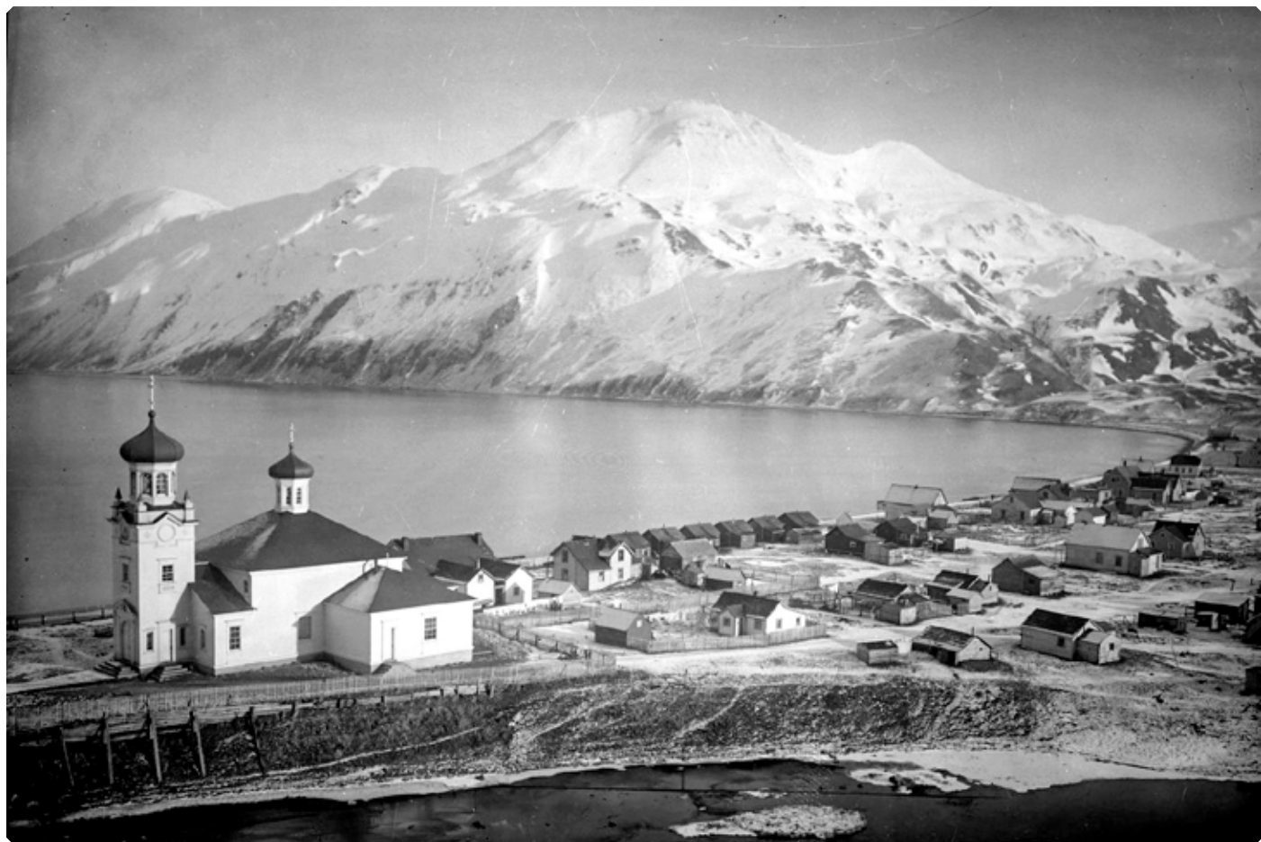
Собор Вознесения Господня в селении Уналашка. Остров Уналашка. Аляска, США. 18 января 1909 г.

своего прихода, везде и всюду являлся со словом утешения, наставления и отеческой любви.