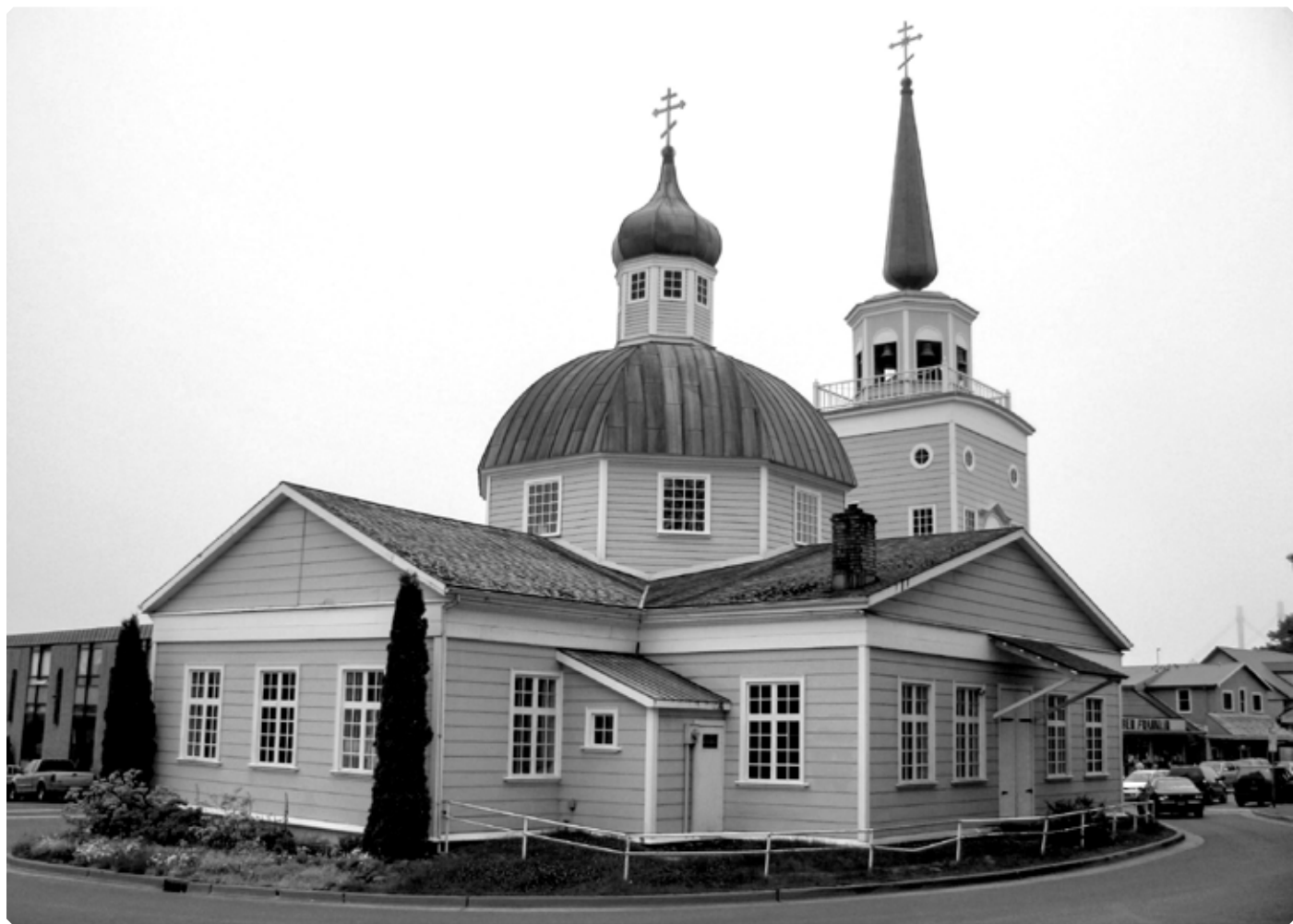
Православный храм Архангела Михаила в городе Ситка. Остров Баранова. Штат Аляска, США. 2008 г.

[2]. Восточный океан – так на русских географических картах до 1917 года назывался Тихий океан. В 1844 году, например, во время активного освоения «Российских владений Америки», гидрографическим департаментом Морского министерства была составлена «Карта Ледовитого моря и Восточного океана».